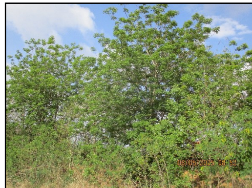
ภาพที่ 2.4 การปลูกต้นไม้โตเร็วและพืชคลุมดิน