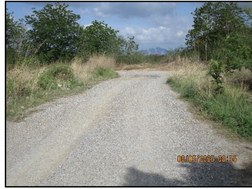
ภาพที่ 2.6 ถนนหินคลุกบดอัดแน่นภายในพื้นที่โครงการ