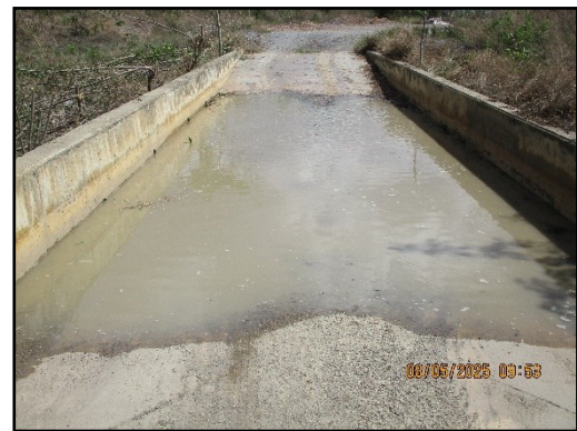
ภาพที่ 2.27 บ่อล้างล้อรถบรรทุก