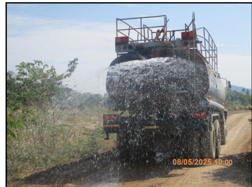
ภาพที่ 2.23 รถบรรทุกน้ำคอยฉีดพรมถนนภายในพื้นที่โครงการ