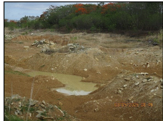
ภาพที่ 2.28 บ่อรับน้ำ Sump