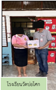
โรงเรียนวัดบ่อโคก