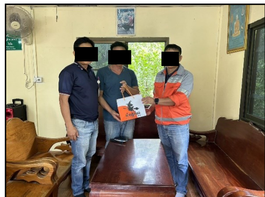
ภาพที่ 2.33 การสำรวจความคิดเห็นของผู้นำชุมชน ประชาชน ในรัศมี 500 เมตร บริเวณเส้นทางขนส่งแร่