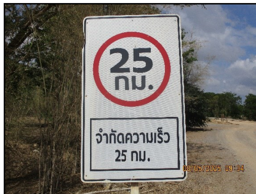
ภาพที่ 2.11 ป้ายจำกัดความเร็วไม่เกิน 25 กิโลเมตร/ชั่วโมง