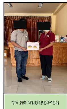
รพ.สต.หนองสองคอน