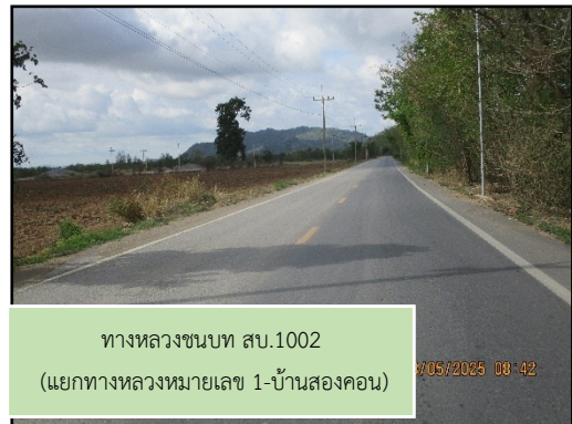
ภาพที่ 2.32 สภาพเส้นทางขนส่งแร่