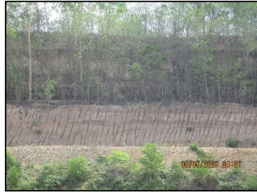
ภาพที่ 2.3 คั่นทำนบดิน