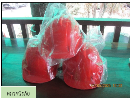
หมวกนิรภัย