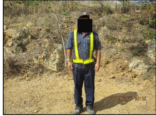
ภาพที่ 2.34 ป้อมสำหรับเจ้าหน้าที่รักษาความปลอดภัย