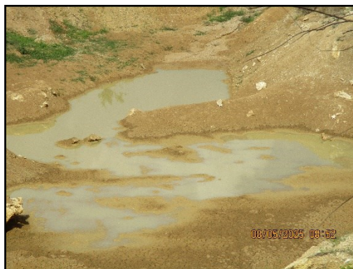
ภาพที่ 2.29 จุดรับน้ำเพื่อนำมาฉีดพรมถนนลำเลียงแร่