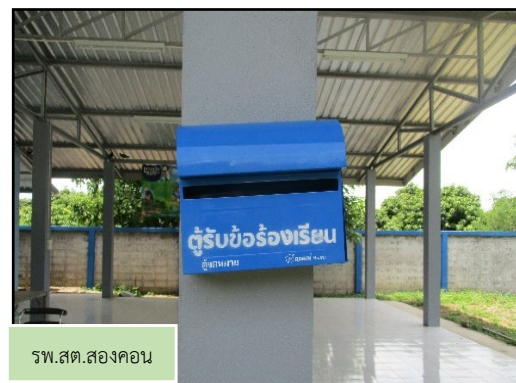
ภาพที่ 2.1 กล่องรับเรื่องราวร้องทุกข์