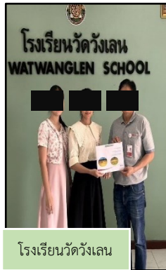
โรงเรียนวัดวังเลน