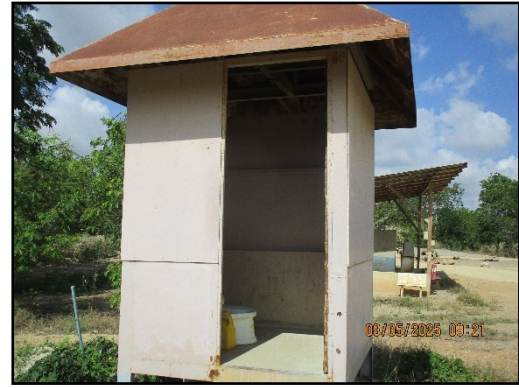
ภาพที่ 2.21 ห้องน้ำภายในพื้นที่โครงการ