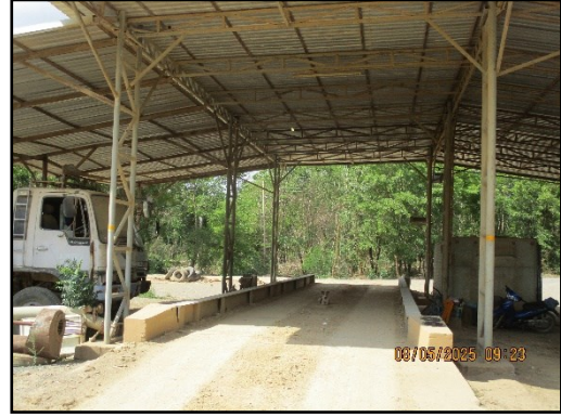
ภาพที่ 2.30 ด้านขังน้ำหนักรถบรรทุกขนส่งแร่