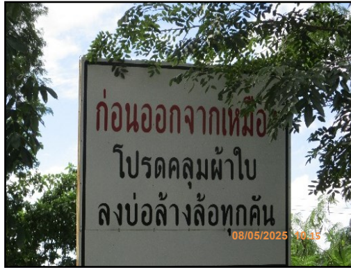
ภาพที่ 2.26 ป้ายเตือนให้มีการปิดคลุมผ้าใบ และลงบ่อล้างล้อก่อนออกนอกพื้นที่โครงการ