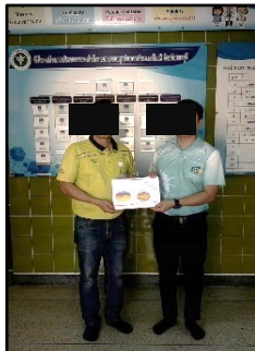
สงข.สาธารณสุขเฉลิมพระเกียรติ

รายงานผลการปฏิบัติตามมาตรการป้องกันและแก้ไขผลกระทบสิ่งแวดล้อมและมาตรการติดตามตรวจสอบผลกระทบสิ่งแวดล้อม โครงการเหมืองแร่ดินอุตสาหกรรมชนิดดินซีเมนต์ คำขอประทานบัตรที่ 6/2551 ของบริษัท ปูนซีเมนต์ไทย (ท่าหลวง) จำกัด ระหว่างเดือนมกราคม-มิถุนายน 2568