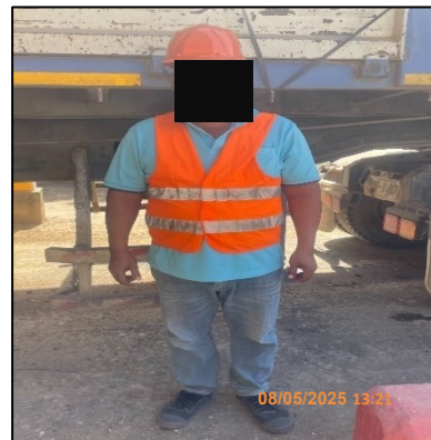
ภาพที่ 2.18 พนักงานสวมใส่อุปกรณ์ป้องกันอันตรายส่วนบุคคล