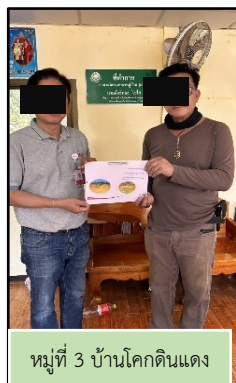
หมู่ที่ 3 บ้านโคกดินแดง