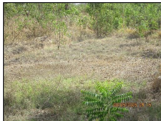
ภาพที่ 2.9 ป่อดักตะกอน