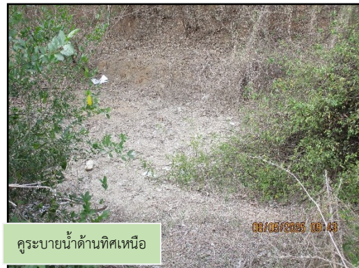
ภาพที่ 2.8 คูระบายน้ำโดยรอบพื้นที่โครงการ