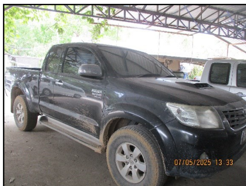
ภาพที่ 2.20 รถฉุกเฉินสำหรับนำคนเจ็บส่งโรงพยาบาล