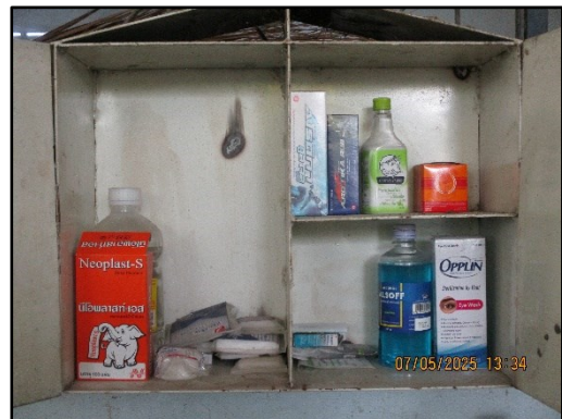
ภาพที่ 2.19 ตู้ยาปฐมพยาบาลเบื้องต้นประจำโครงการ