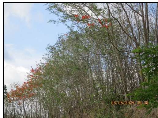
ภาพที่ 2.5 การปลูกต้นไม้บริเวณพื้นที่เว้นเขตการทำเหมือง