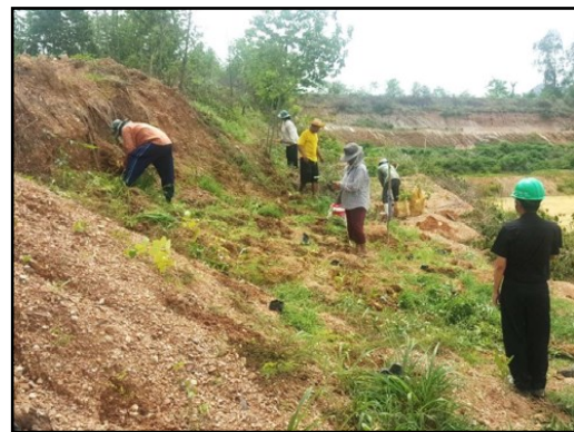
ภาพที่ 2.7 การดูแลรักษาต้นไม้ภายในพื้นที่โครงการ