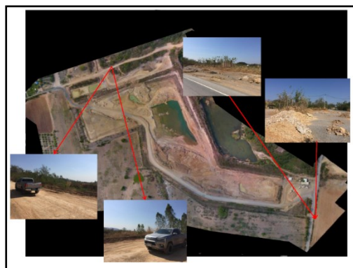
ภาพที่ 2.2 การเว้นระยะห่างจากทางสาธารณะประโยชน์