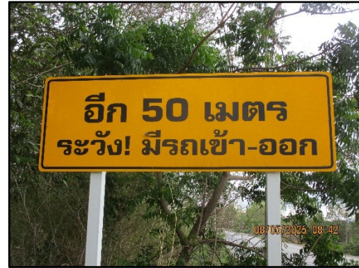
ภาพที่ 2.10 ป้ายสัญญาณจราจรและสัญญาณไฟกระพริบภายในพื้นที่โครงการ