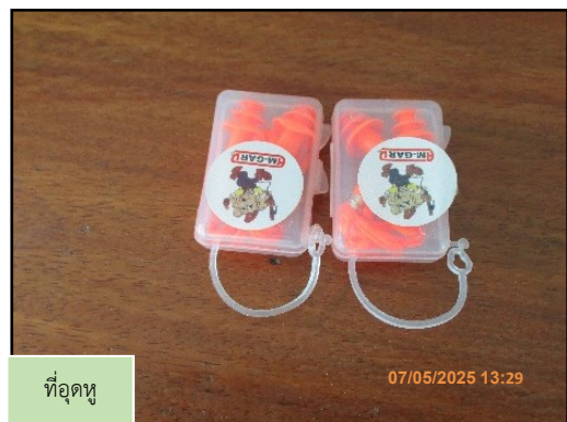
ที่อุดหู