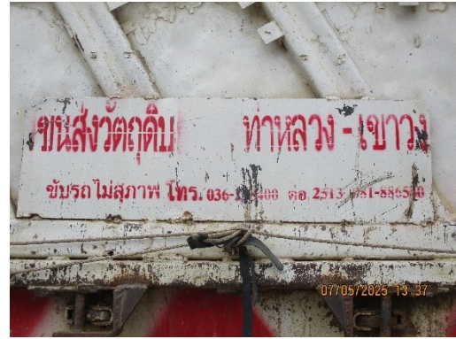
ภาพที่ 2.13 รถบรรทุกที่มีการติดชื่อโครงการ