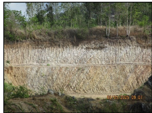
ภาพที่ 2.22 การเปิดหน้าเหมืองลักษณะชั้นบันได