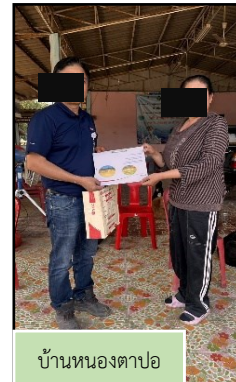
บ้านหนองตาบ่อ