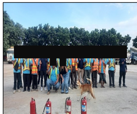
ภาพที่ 2.12 การอบรมด้านอาชีวอนามัย