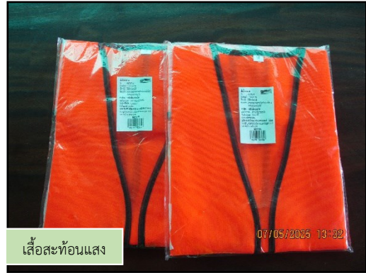
ภาพที่ 2.17 (ต่อ) อุปกรณ์ป้องกันอันตรายส่วนบุคคล