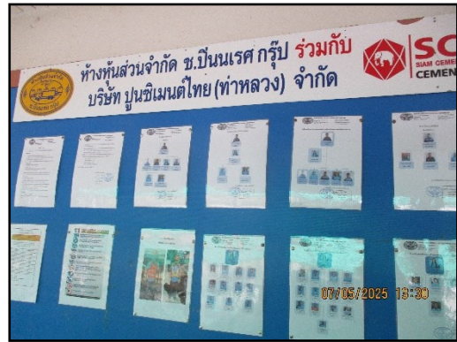
ภาพที่ 2.15 บอร์ดประชาสัมพันธ์ความรู้ต่างๆ ภายในพื้นที่โครงการ